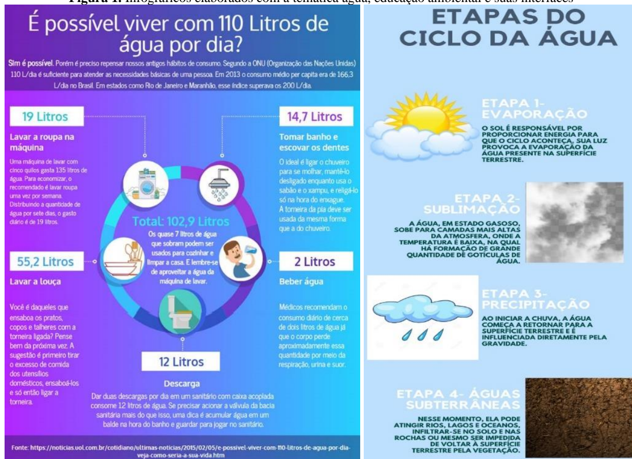
Figura 1. Infográficos elaborados com a temática água, educação ambiental e suas interfaces

A Figura 1 denota os infográficos elaborados com temas relacionados a água e suas interfaces nos quais foram expostos na aplicação do questionário.